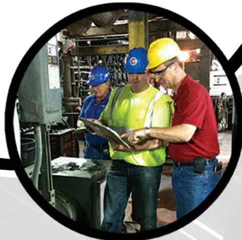
Evaluación de confiabilidad de equipos Xpert