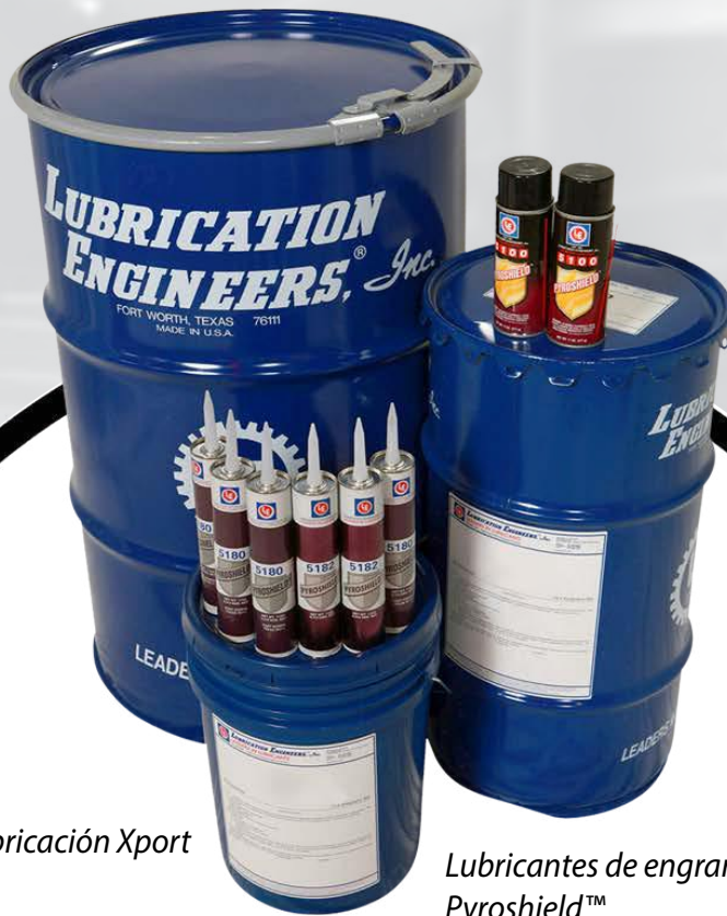
Sistema de lubricación Xport Automatic

Hiornos, molinos de acabado y otras aplicaciones de engranajes abiertos ya no son un lugar desagradable en el que nadie quiere estar. Pyroshield es una solución fresca, transparente, limpia y bombeable para lubricar fácilmente engranajes abiertos a un costo final muy inferior.