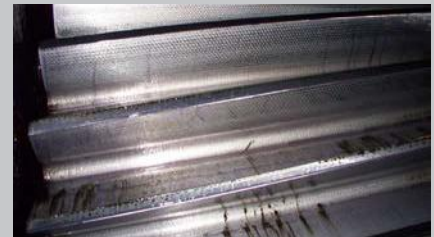
Después de la conversión Pyroshield

A diferencia de algunos lubricantes de engranajes abiertos (arriba), Pyroshield es translúcido (abajo), lo cual facilita la inspección visual de los engranajes. Pyroshield presenta mayor viscosidad que la mayoría de los productos competidores y, al mismo tiempo, no se acumula sobre sí mismo ni causa problemas en la boquilla de pulverización o en el sistema de lubricación.