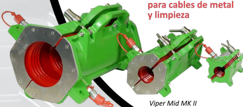
Viper Maxi MK II

Aplicación de lubricante para cables de metal y limpieza