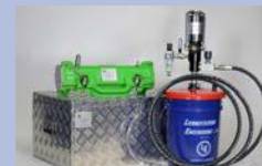
Sistema de lubricación automática