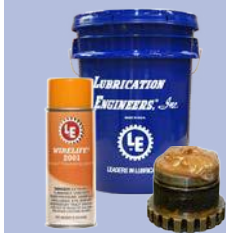
Lubricantes de recubrimiento y penetración